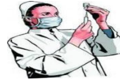
نقابة مهنة التمريض