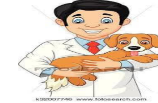
نقابة اطباء البيطرين