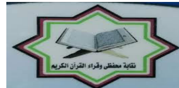
محفظي القرآن الكريم