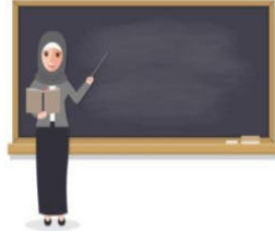
نقابة المهن التعليمية