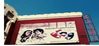
نقابة المهن التمثيلية