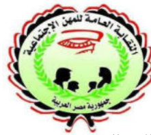
نقابة المهن الاجتماعية