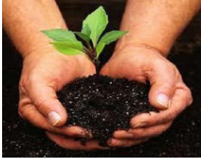
نقابة المهن الزراعية