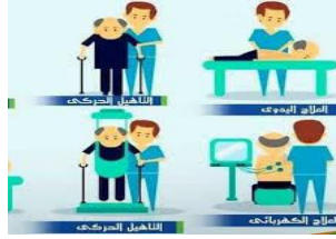
نقابة العلاج الطبيعي