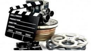
نقابة المهن السينمائية