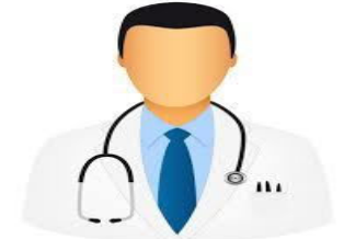
نقابة اطباء البشرين