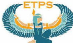
نقابة المرشدين السياحيين