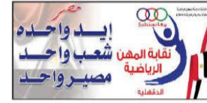
نقابة المهن الرياضية