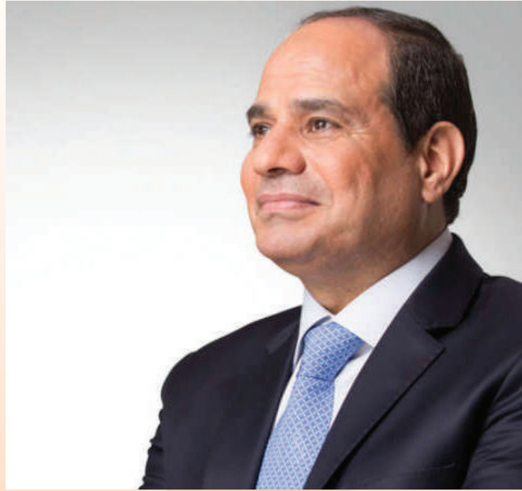
الرئيس / عبد الفتاح السيسي رئيس جمهورية مصر العربية